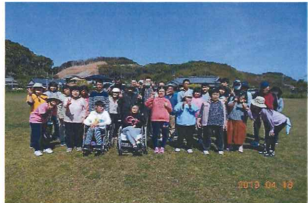
さあー！みんなバター、やない、チーズ！

毎年、高知ライオンズクラブの映画の招待を受け、今年もイオンの東宝シネマズで映画を見たあと、高知市池の公園でお昼を食べ、皆でアスレチックなどを楽しみ、のんびりと過ごしました。