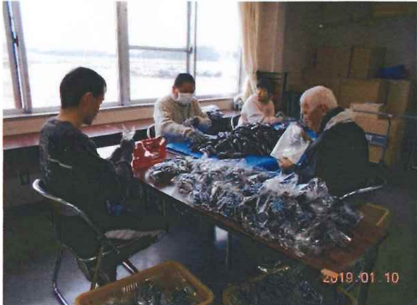
なすの袋詰め作業

10月から6月にかけて、ナスの袋詰め作業に取り組んでいます。L・M・Sサイズそれぞれバランスを取りながら袋に入れます。