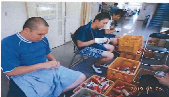
空き缶プルタブはずし作業

梅雨時は外での空き缶作業ができないので、屋内でスチール缶、アルミ缶の選別作業やプルタブ外しを行なっています。