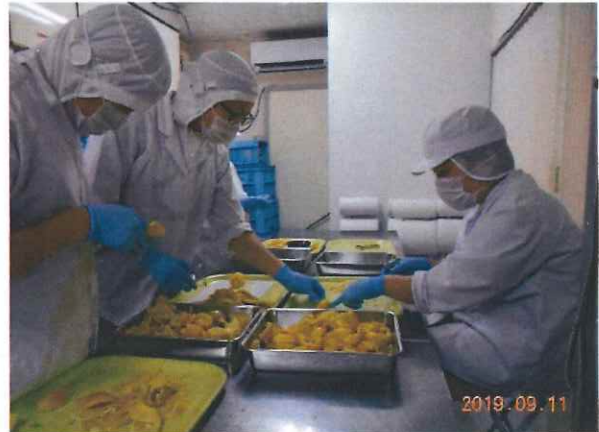
ゆずのトリミング作業

就労Bは北川村ゆず王国さんの協力で、ゆず皮トリミングをメインにしています。しかし時期によって、セトカ・レモンといった他の柑橘もあります。