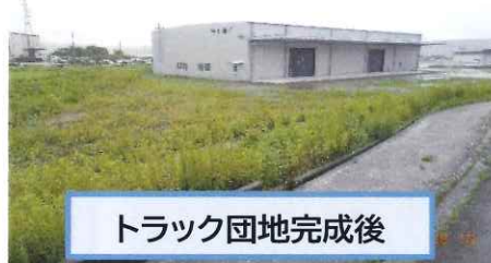
トラック団地完成後