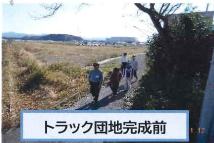
トラック団地完成前

以前の駐車場では季節毎に、“凧あげ”やバーベキュー等と楽しんできましたが、今年からは新しい場所と楽しみを見つけなければなりません。