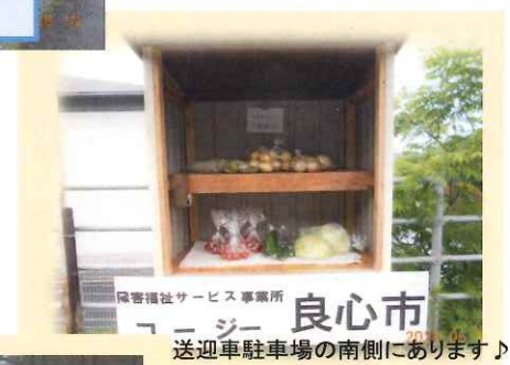
良心市 送迎車駐車場の南側にあります♪

どれでも1袋50円として定着してきました。時々、100円の品もあります。びっくりするくらい大盛りの時もあります。傷があったりもしますが、その部分は切り落として上手に調理している方もいらっしゃいます。使い方によりかなりお得です。私たちは、「今日も、全部売れますように！」と野菜に言葉をかけて良心市に並べています。是非、「コージの良心市」をのぞいてみて下さい。